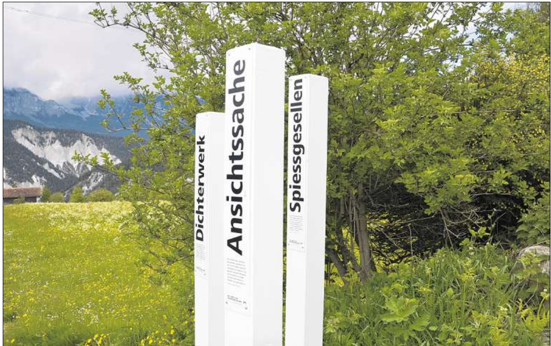
Die Pfosten sind ein Instrument für die Öffentlichkeitsarbeit von Bauern.